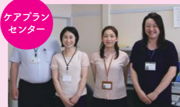
中嶋ケアプランセンター TEL.022(292)0507 FAX.022(292)6201