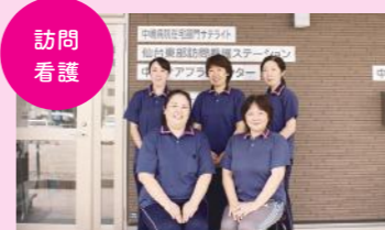
仙台東部訪問看護ステーション TEL.022(296)2055 FAX.022(292)2628