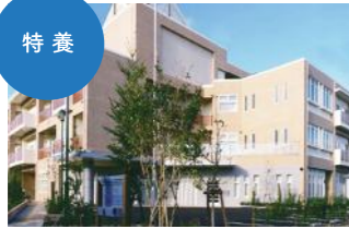
特別養護老人ホームJ&B 長期入所・ショートステイ [平成17年10月開設]