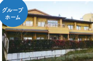
グループホームやわらぎ [平成16年4月開設]