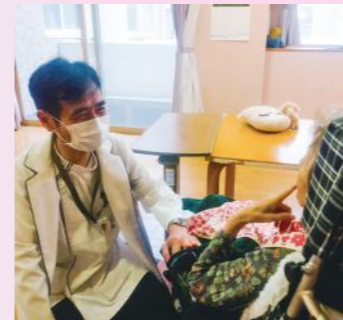
中嶋病院嘱託医 による住診 (特別養護法人ホームJ&B)