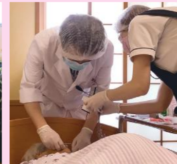
協力歯科医院 による定期往診 (法人内各事業所)