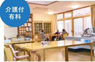
介護付 有料老人ホームJ&B [平成29年4月開設]