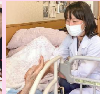
中嶋病院在宅部門 との連携 [介護付有料老人ホームJ&B グループホーム3施設]