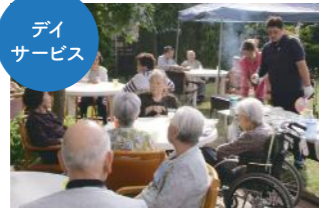
清水沼デイサービスセンター [平成17年10月開設]