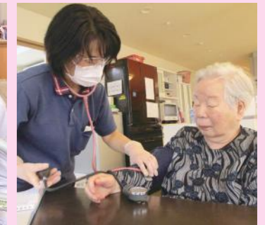
仙台東部 訪問看護ステーション との連携 [グループホーム3施設]