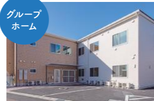
グループホームJ&B小田原 2号館 [令和2年4月開設]