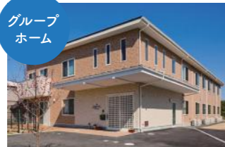
グループホームJ&B小田原 [平成27年4月開設]